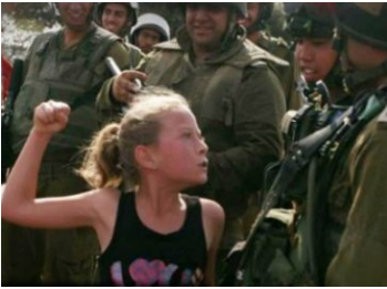
Filistinli Temimi'nin Gözaltı Süresi Uzatıldı