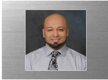
Mubin Şeyh'in Trump'a Desteği ve İtirafçı Cihat Yanlıları