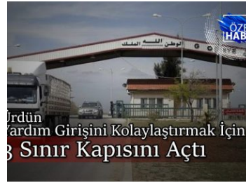
Ürdün Yardım Girişini Kolaylaştırmak İçin 3 Sınır Kapısını Açtı