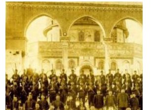
Osmanlı Zamanı Kudüs